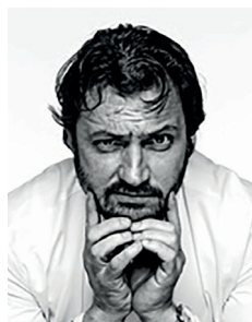
Yves CAMDEBORDE Chef cuisinier

« La Cécité des rivières » (Gallimard, 2022)