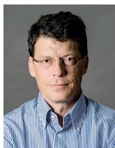
Laurent ALEXANDRE Haut fonctionnaire, entrepreneur, chroniqueur, écrivain

« Quand la parole détruit » (Éditions de l'Observatoire, 2023) avec Roger-Pol Droit « Le sens des limites » (Éditions de l'Observatoire, 2021) « L'espoir a-t-il un avenir ? » (Flammarion, 2016)