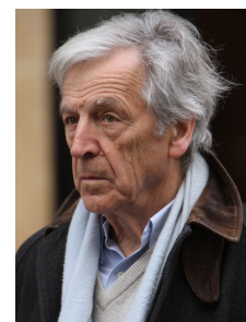
COSTA-GAVRAS Cinéaste franco-grec

« Ovalix : une histoire gourmande du rugby (Albin Michel, 2023) « Gabin à table » (Michel Lafon, 2023) « Le grand Livre des livres de cuisine » (Gallimard, 2023)