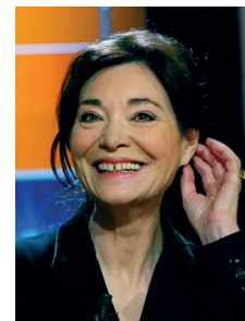
Paule CONSTANT Écrivaine, Prix Goncourt, Grand Prix du roman de l'Académie française

« La France de l'à-peu-près » (Éditions de l'Observatoire, 2023)