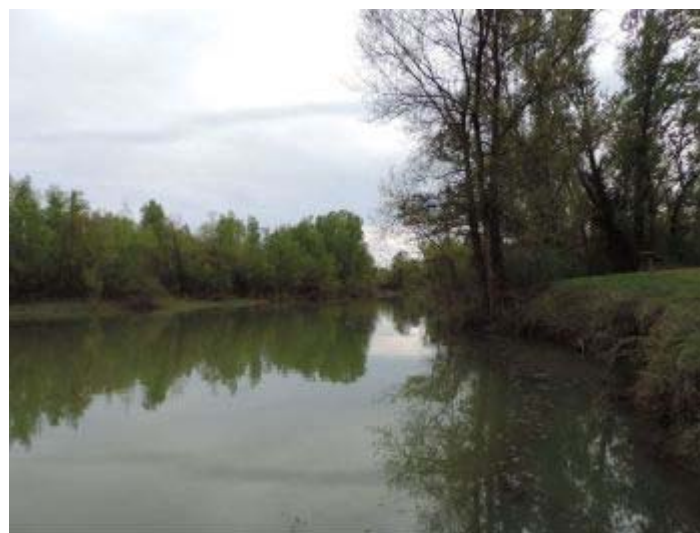
Saligue de Bordères

Au plan scientifique, cette recherche constitue un acquis supplémentaire de connaissances et un champ de comparaison avec les démarches conduites précédemment en zone de montagne (vallée du Saison) et sur le piémont pyrénéen (Gave de Pau). L'expérience de l'équipe a démontré que tous les milieux constitutifs de l'hydrosystème ainsi que les diverses occupations humaines et leurs usages sont à prendre comme des facteurs pertinents. La méthodologie présentée permettra de mettre en lumière une mosaïque de faits culturels liés à ce fleuve et de pratiques constituant un patrimoine commun, à partir duquel pourront se définir des objectifs de développement soutenable.