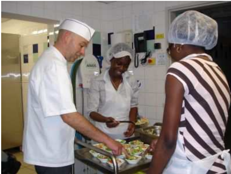
Préparation des plats à Cap sud avec des étudiantes et le chef