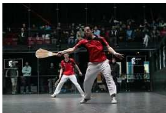
Finale baline homme : Toulouse/ UPV-EHU - (Photo Marie-Claude Delbost)

Ecole de tolérance, de loyauté, de respect et de solidarité Zabalki 2012 fut de nouveau la vitrine universitaire de nos meilleurs espoirs mondiaux.