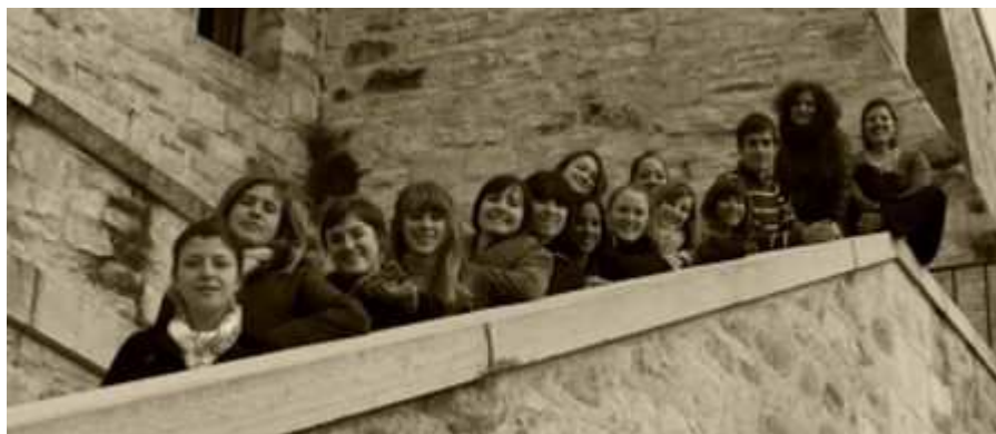
Les étudiants d'ACTI