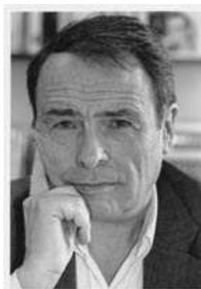
Pierre Bourdieu